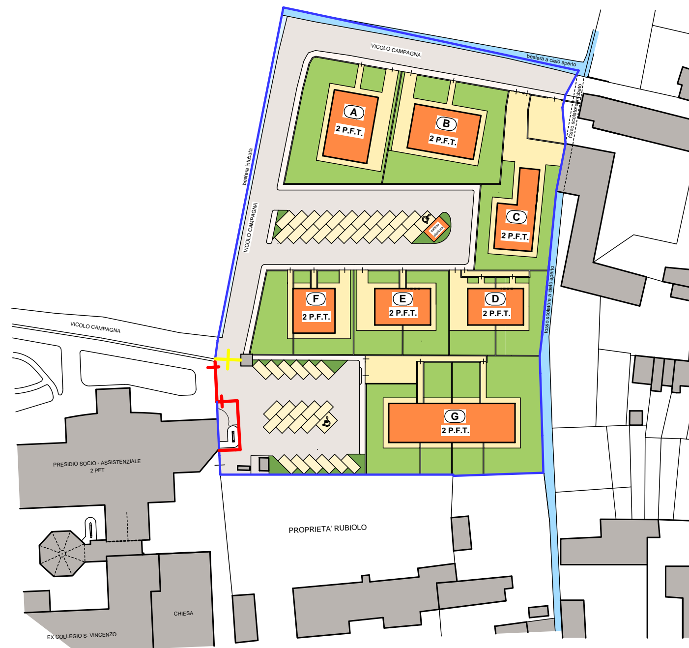
PLANIMETRIA GENERALE scala 1/1000